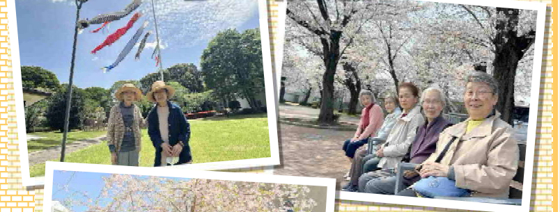
花と新緑にあふれた園内を散策♪