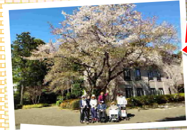
2号館の近くでお花見