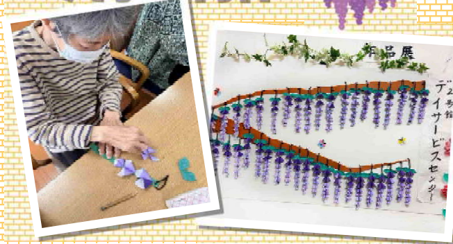
一人一人が作った藤の花で大きな藤棚が完成しました！