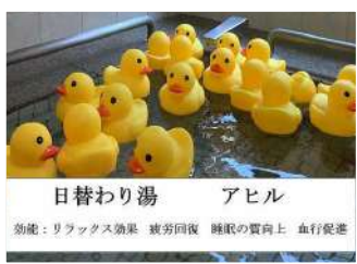
日替わり湯 アヒル 効果：リラックス効果 疲労回復 睡眠の質向上 血行促進