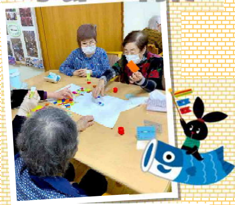
5月に向けて鯉のぼりの貼り絵を制作