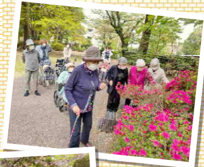
八重桜やツツジを観に園内を散策