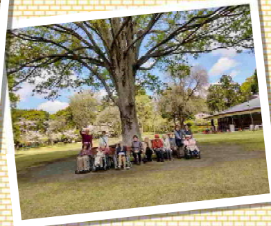
自然の中を歩いたりお話しを楽しみました♪