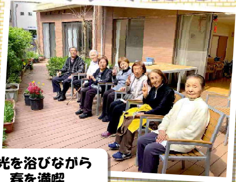
日光を浴びながら春を満喫