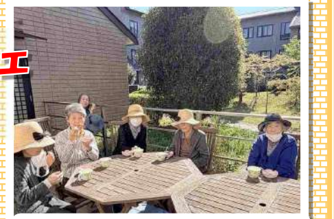
テラスで緑茶とどら焼きを召し上がっていただきました！