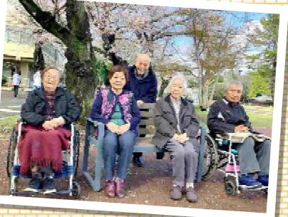
満開の桜と一緒に記念撮影！