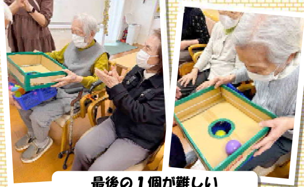
最後の1個が難しい「コロコロボール落とし」