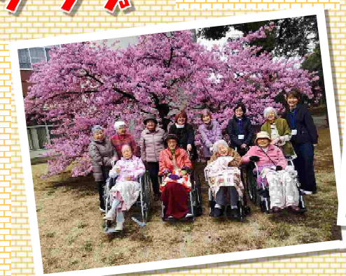
見頃を迎えた河津桜を観に初春の園内を散策