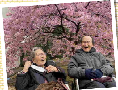
河津桜が満開でした!