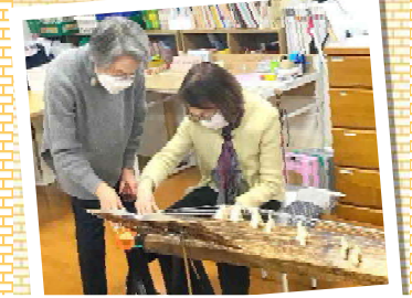
実際に箏曲を弾いてみました。とても素敵な体験でした!