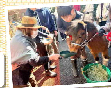
餌やり体験やパロンくん(ポニー)への質問タイムなどを楽しんでいただきました!