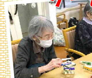
牛乳パックジェンガ