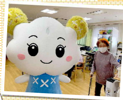
もらんちゃん来訪!