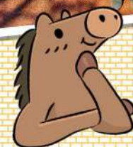
麗澤大学馬術部のご協力でポニーふれあい体験を開催しました!