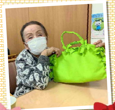
フェルトのみで作るオリジナルバッグを制作