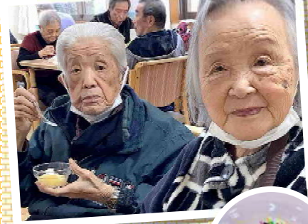
スペシャルおやつ「こだわりプリン」