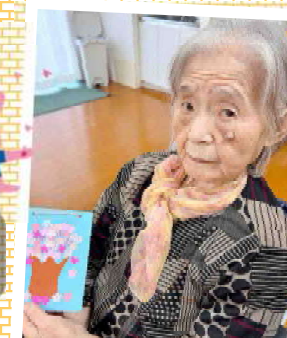
色紙を使って満開の桜を制作