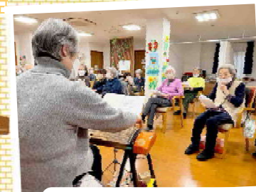
箏曲の先生をお招きして演奏会を開催!