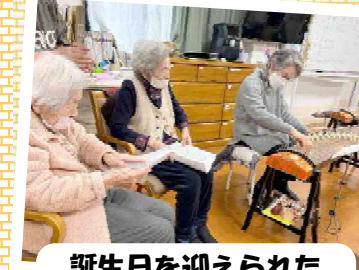
誕生日を迎えられたご利用者のために演奏を披露♪