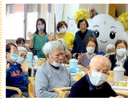
介護予防運動指導員による特別な運動プログラム