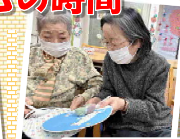
お手玉配達ゲーム