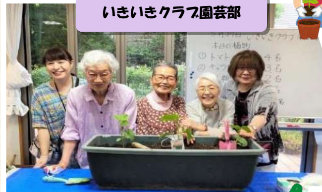
いきいきクラブ園芸部