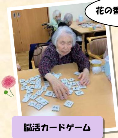
脳活カードゲーム