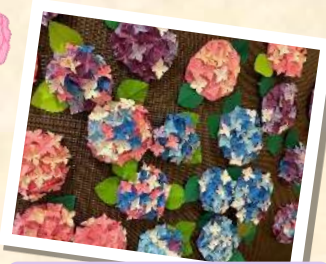
紫陽花の壁飾り制作