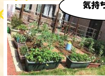
中庭で野菜の栽培