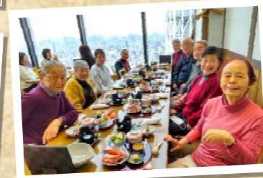
スカイツリーのレストランで昼食