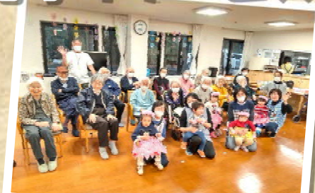
あおいルームの子どもたちとひなまつりを楽しみました