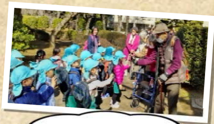
麗澤幼稚園の子どもたちと会いました!