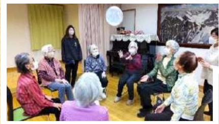
節分にふさわしく「的当て」「風船バレー」「豆つかみ」「健康体操」を行いました