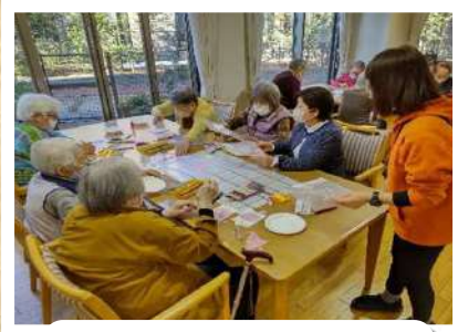
季節の表紙作り「桜アート」を制作♪