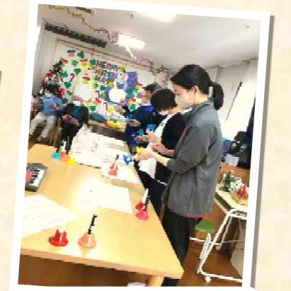
スタッフが ハンドベルを披露