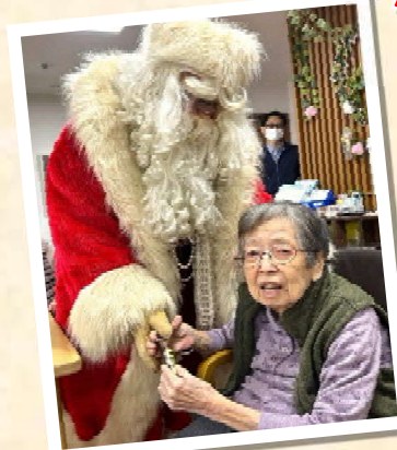
2号館にもサンタさんが 来てくれました！