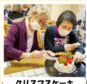
クリスマスケーキ作り