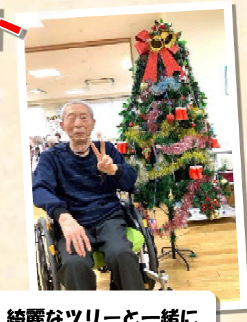
綺麗なツリーと一緒に