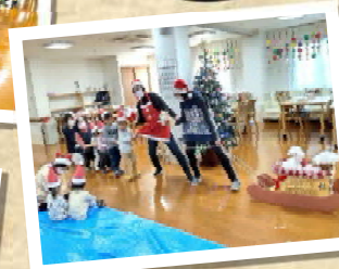
「見守りサービス」を ご利用中の入居者様と 一緒にクリスマス会！