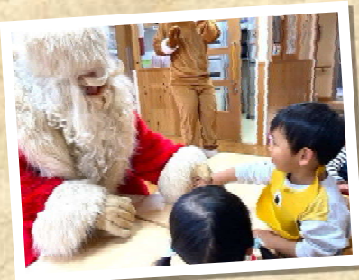
サンタさんと握手！