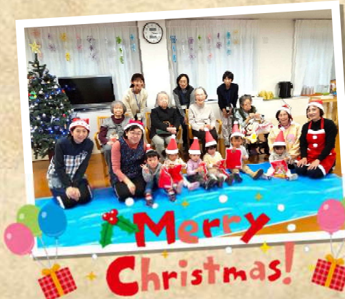
今日はありがとう！ 握手！！