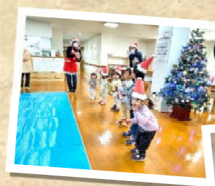
合奏やパペット劇 「サンタさんのお話」を 披露しました