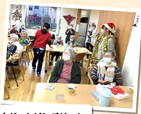
盛り上がったビンゴゲーム