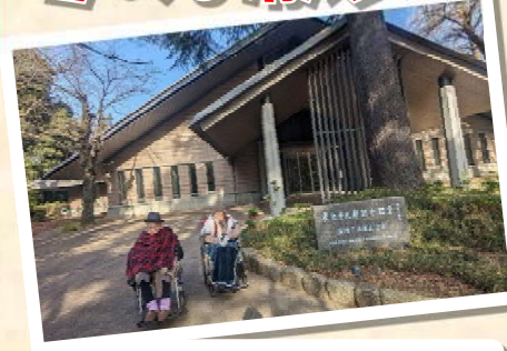
園内へお散歩に行きました