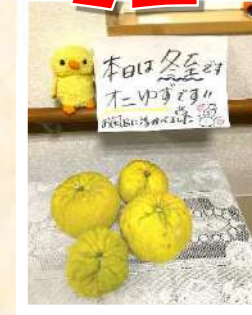
オニゆずのお風呂に 浸かって温まりました