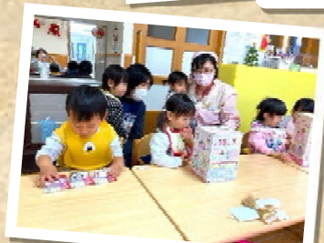
プレゼントをもらったよ！