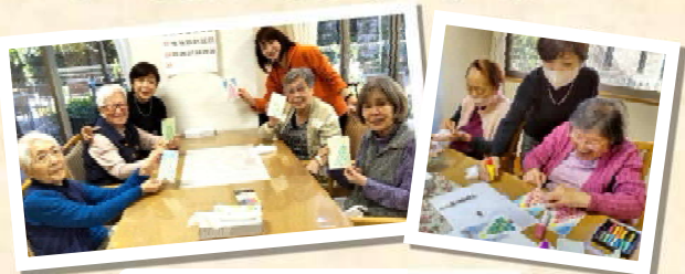
クリスマスカード作り