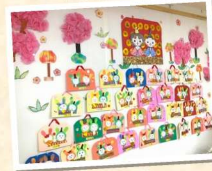
個性豊かなうさぎ雑が大集合！