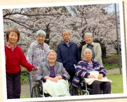
桜やたくさんの花が咲いた園内を皆さんで散策しました