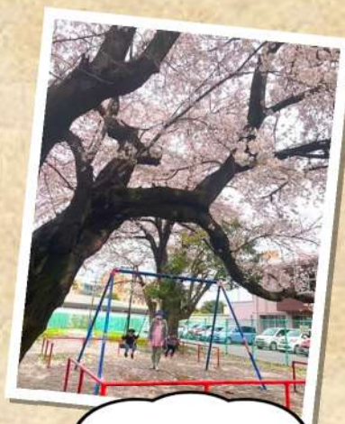
近くの公園も 桜が満開だったよ！