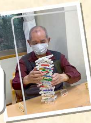
崩さないよう慎重に… つつい夢中になります