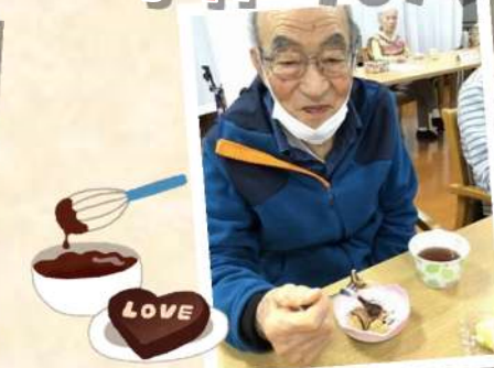
チョコシューを作りました！