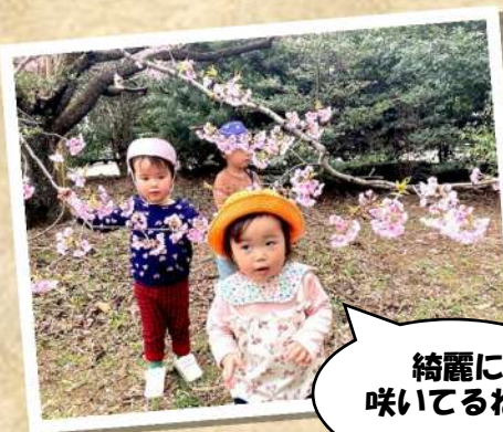
綺麗に 咲いてるね！