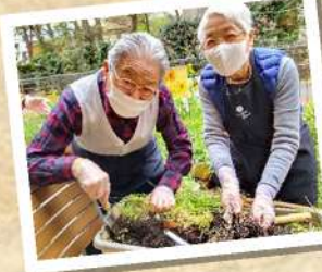
エシャレット収穫