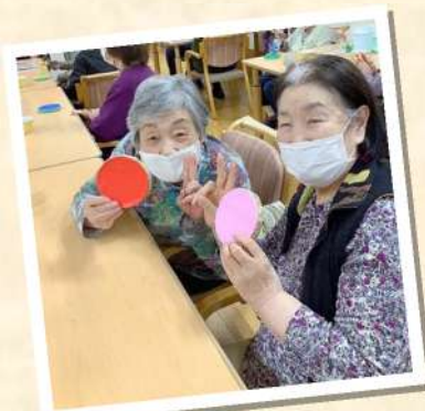
カスターネットも 手作りです