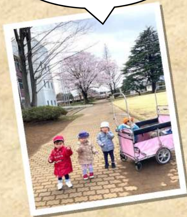
みんなで 仲良くお散歩♪