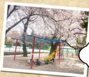
砂場も花びらで いっぱいだね！