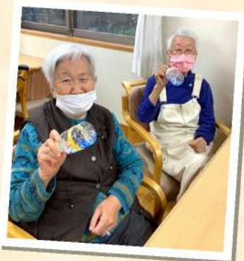
ペットボトルのマラカス